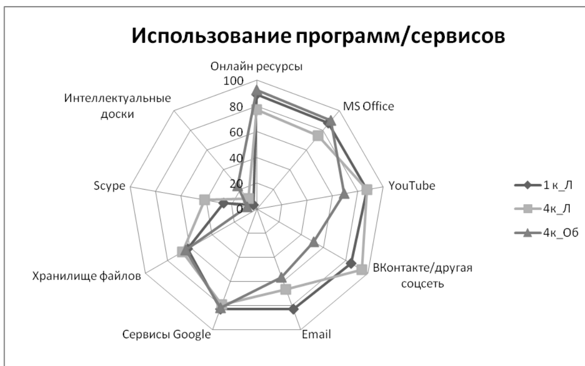
Рис. 1. Использование программного обеспечения/сервисов в личных целях(Л) и целях обучения(Об) студентами первого и четвертого курсов

На рисунке 1 ниже мы показываем виды программного обеспечения, к которому чаще всего обращаются учащиеся. Доминирующее положение занимают продукты, связанные с «онлайн-ресурсами»: переводчики, компиляторы, сервисы для создания презентаций и т.д. (в последовательности, представленной на рисунке: 89%; 77%; 92%).